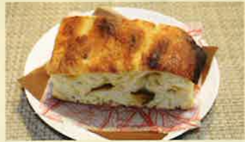
安納いもの焼いもフォカッチャ 220円(税込)