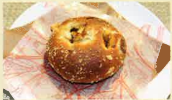
小江戸黒豚カレー 300円(税込)