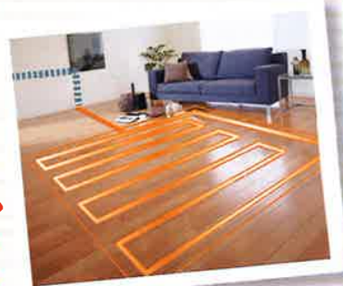
床暖房イメージ写真

毎年冬になると、エアコンの影響により空気の乾燥でノドが痛くなったり、お肌が乾燥したりすることはありませんか?でもエアコンを使わないと寒い…。そんなときは床暖房がオススメです。床暖房は風を起こさないで、皮膚の水分が奪われにくく肌を乾燥させません。お部屋も乾燥しにくいのでノドにやさしく、風邪をひきにくくなります。