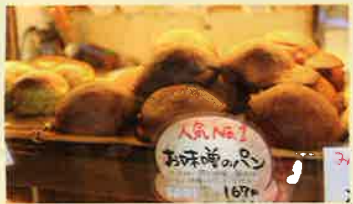
お味噌のパン 180円(税込)

雰囲気。また、パンの素材にもこだわっており、9割北海道、1割埼玉県の国産小麦粉を使用、「パンは畑の恵み」を体感するため、北海道の畑まで行き農家の方の話を聞いて理解を深めています。名物商品は「お味噌のパン」。お味噌のしょっぱさが引き立つほどよい甘さが口の中に広がります。お近くを通った時は、ぜひお立ち寄りください。