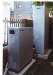
「エネファームの全景」 手前が電気をつくる 発電ユニット 奥がお湯を貯める 貯湯ユニット