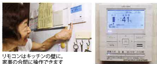
リモコンはキッチンに壁に。家事の合間に操作できます。電気・ガスの使用量やCO 2 削減量などが表示されるリモコン。もしも停電時に発電を継続する自立運転機能も備えています。

家庭ほど、割安感が高まると言われていますが、ご家族3人暮らしで「電気使用量はもともと多くない」とおっしゃるNさまご夫妻の場合、どんな感想をお持ちなのでしょう。ご主人の実感では「電気代はかなり安くなった」とのこと。ガスについては「発電の熱を利用してお湯が沸いているんですね。せっかく沸いているなら、とバスタブの湯に毎日浸ったり、食器洗いにお湯も気軽に使ったりできるようになりました。床暖房もお湯もふんだんに使っているのに、その割にはガス代が安いです」と教えてくださいました。