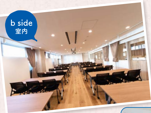
b side 室内