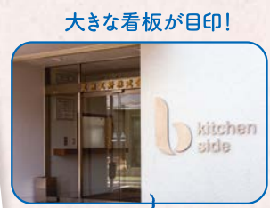
大きな看板が目印!