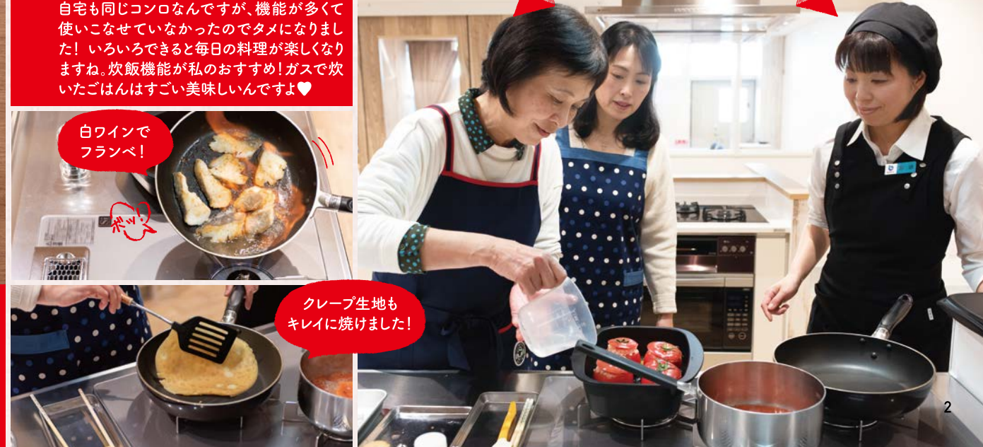
白ワインで フランベ!