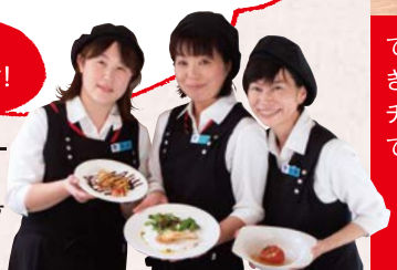
武州ガス クッキングインストラクター