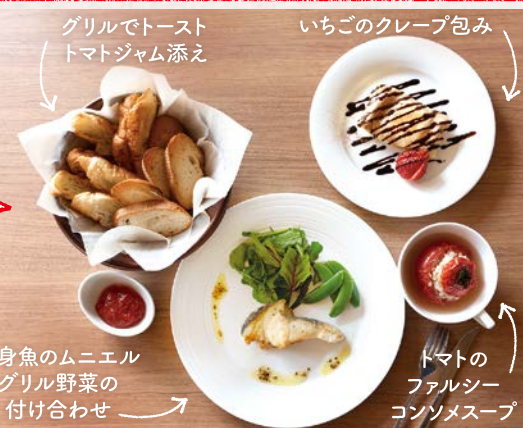
グリルでトースト トマトジャム添え いちごのクレープ包み 白身魚のムニエル グリル野菜の付け合わせ トマトのフルシー コンソメスープ

できたてほやほやの「b kitchen」をモニターの方に使用していただきました。メニューは「おもてなしクッキング～春のフレンチ～」。ダッチオーブンを使って4品を同時調理するのがポイント。身近な材料でできる本格フレンチは、ご自宅でも試したくなるレシピです。