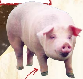
ゴールデンポーク