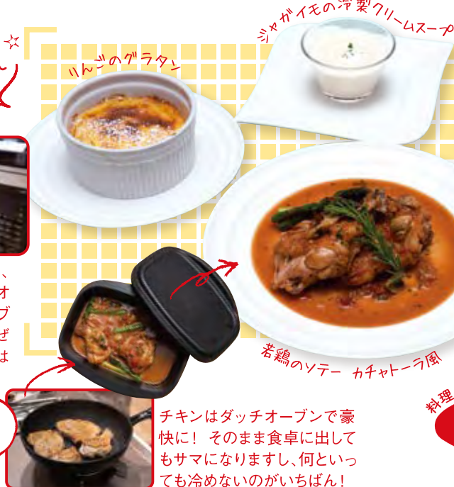
ハートのグラタン