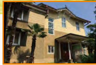
◀2階建ての洋館には、洋室のほか数寄屋造りの和室も。これは皇族方をお迎える目的もあったからだそうです。