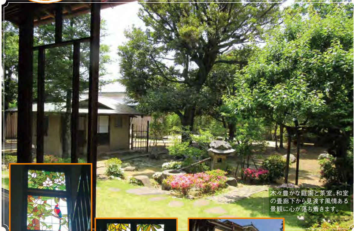
木々豊かな庭園と茶室。和室の豊廊下から見渡す風情ある景観に心が落ち着きます。

川越・蔵造りの町並みのすぐ近くに、国の重要文化財!? 100年近く前の近代住宅と庭園を観てまったり過ごしてみませんか?