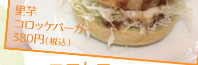
里芋 コロッケバーガー 380円(税込)