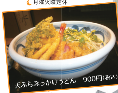
天ぷらぶっかけうどん 900円(税込)