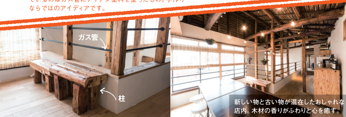
新しい物と古い物が混在したおしゃれな店内。木材の香りがふわりと心を癒す。

廃材の柱はベンチに再利用。手すりの棧(さん)に使用しているのはガス管にアイアン塗料を塗ったもの。手作りならではのアイデアです。