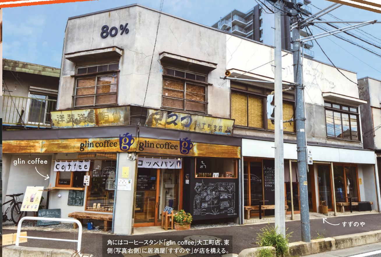
角にはコーヒースタンド「glin coffee」大工町店、東側(写真右側)に居酒屋「すずのや」が店を構える。

「川越には地元の方々が大切に守ってきた建物や一生懸命つくってきた文化があります。みんなもう十分頑張ってきたし、これだけ住民に力があるのだから、これからは少し力を抜いているんな世代が享受し合える街になればいいなと思います」