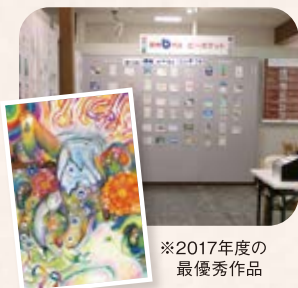
※2017年度の最優秀作品

まずは、創立75周年を記念して開催した当社主催のコンサート。今回で18回目を迎えたこのコンサートは、お客さまへの感謝の意を込め、無料でご招待しており、応募倍率は十数倍にもものぼる人気の催事となりました。当日はチャリティ募金を行い、皆さまの善意は災害義援金や各行政の社会