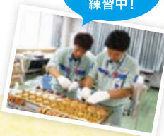
大判焼き作り練習中！

武州大判焼き 人気の大判焼きは、社員の手づくり。上手に焼けるよう猛特訓して本番に臨みます！