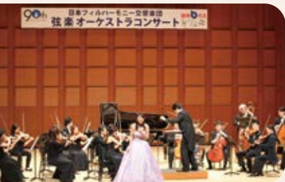
日本フィルハーモニー交響楽団を招いての弦楽オーケストラコンサート。クラシックやポピュラーの名曲が演奏されます。

武州ガスでは、地域の皆さまの健康や、コミュニケーションの向上に少しでもお役にたてればと、文化スポーツの支援活動を行っています。今回は、その中からいくつかご紹介します。