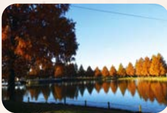
野鳥も集う池を横目に軽快に疾走。メタセコイアの紅葉が見ごろです。

川越エリアで気軽に運動ができるスポットとしておすすめしたいのは、川越水上公園。ウォー