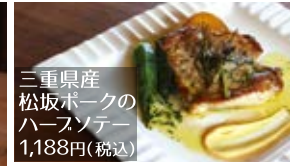
三重県産 松坂ポークの ハースンテー 1,188円(税込)