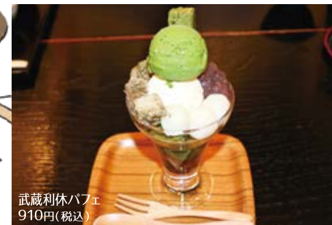
武蔵利休パフェ 910円(税込)