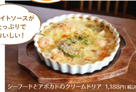
シーフードとアボカドのクリームドリア 1,188円(税込)