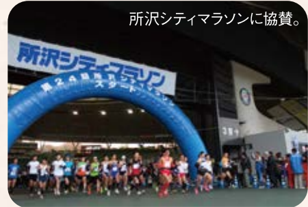
所沢シティマラソンに協賛。

福祉協議会へ寄付しています。「小学生書道コンクール」「中学生環境イラストコンテスト」「高校生学園祭ポスターコンテスト」は、武州ガス供給エリア内の児童・生徒に向けて毎年開催。作品は、武州ガスのギャラリースペース「ピーポケット」(川越アトレマルヒロ6F)に期間限定で展示を行っています。スポーツ関連では「所沢シティマラソン」や「小江戸川越ハーフマラソン」への協賛のほか、少年野球大会や、少年サッカー大会の後援も行っています。