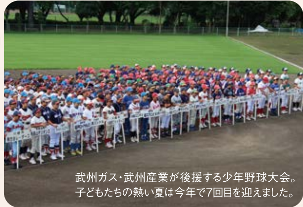
武州ガス・武州産業が後援する少年野球大会。子どもたちの暑い夏は今年で7回目を迎えました。